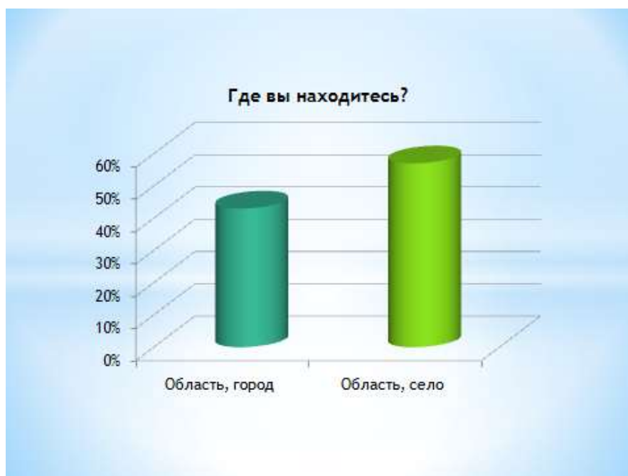
Рис. 2 Место расположения руководителя НПО.

получения грантов, соцзаказов от госорганов. Для этого органам юстиции на местах важно проводить правовые всеобучи.