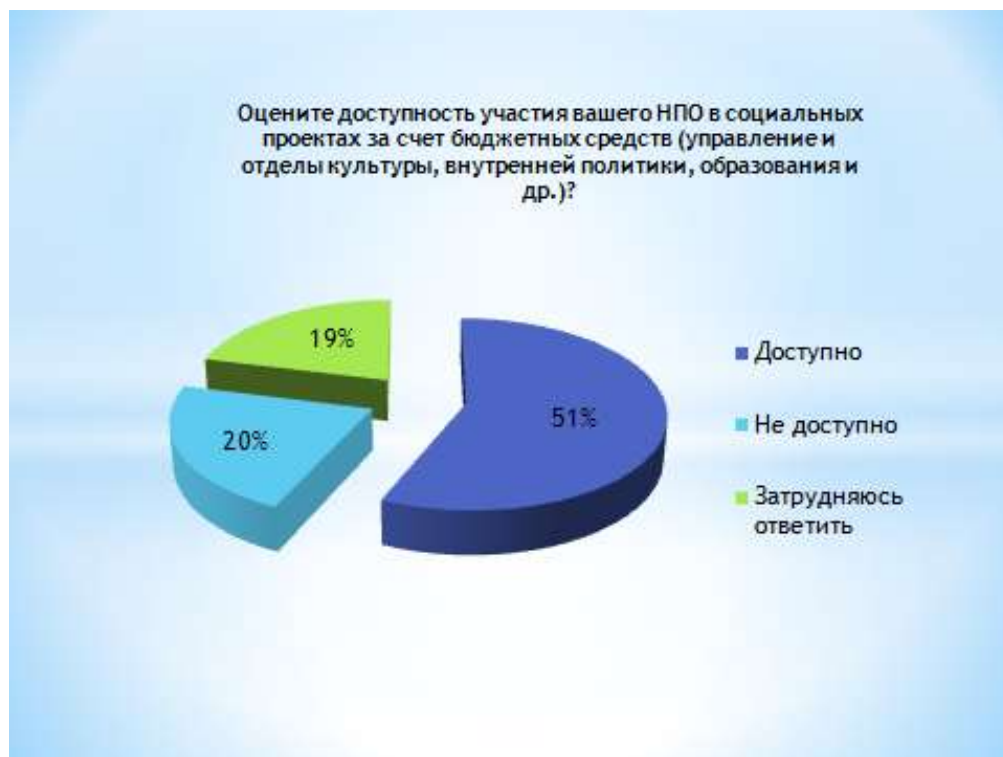
Рис. 5 Оценка доступности участия НПО в социальных проектах за счет бюджетных средств.

Составлена автором на основе проведенного социологического опроса.