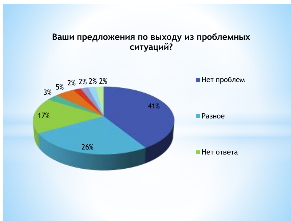
Рис. 7 Предложения по выходу из проблемных ситуаций.

Составлена автором на основе проведенного социологического опроса.