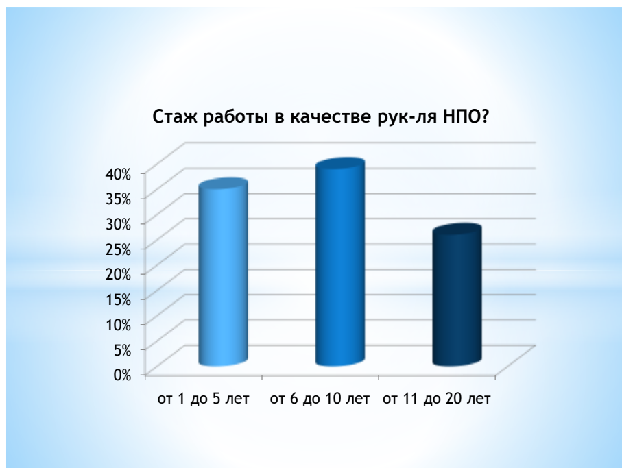
Рис. 1 Стаж работы в качестве руководителя НПО.

По результатам социологического опроса был извлечен практический материал - ответы респондентов района М. Жумабаева СКО. Каждый имел возможность поделиться своими мнениями, исходя из опыта.