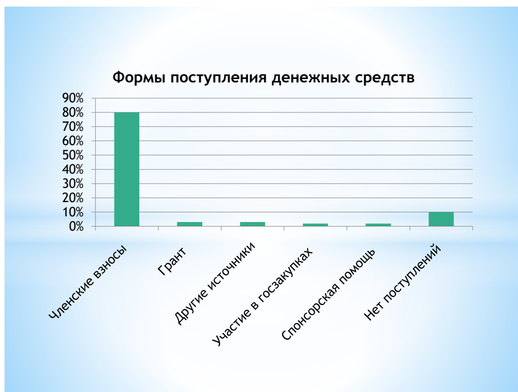
Рис. 4 Формы поступления денежных средств.

В целом, 59% удовлетворены взаимодействием государства и гражданского общества.