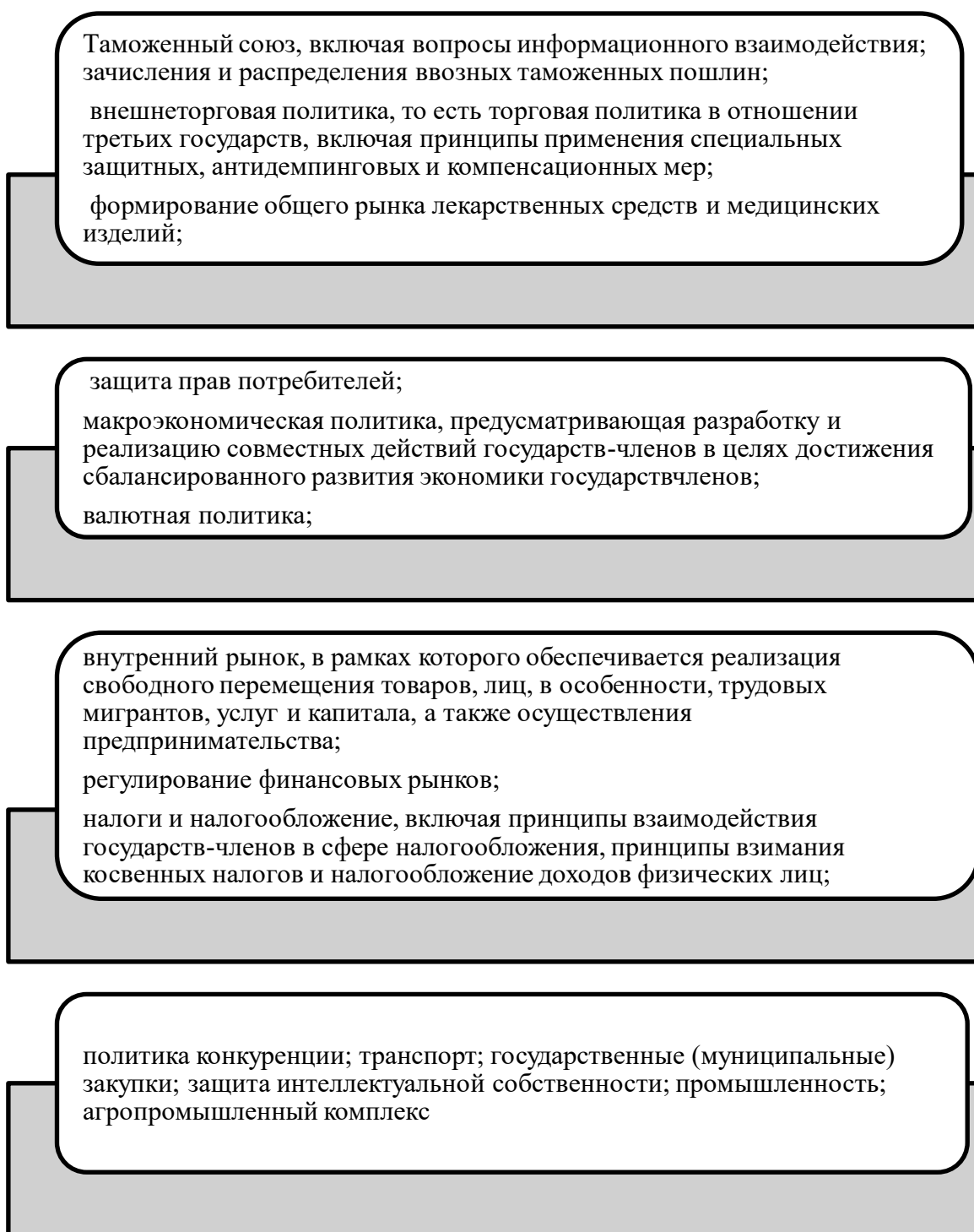
Рис. 1- Компетенции, которые государства-члены передали ЕАЭС [22]

Таким образом, ЕАЭС имеет право утверждать акты прямого действия для РК и эти акты обладают прямым действием, имеют приоритет над национальными прямыми актами и обязаны для исполнения всеми органами РК, так же как и других государств-членов.