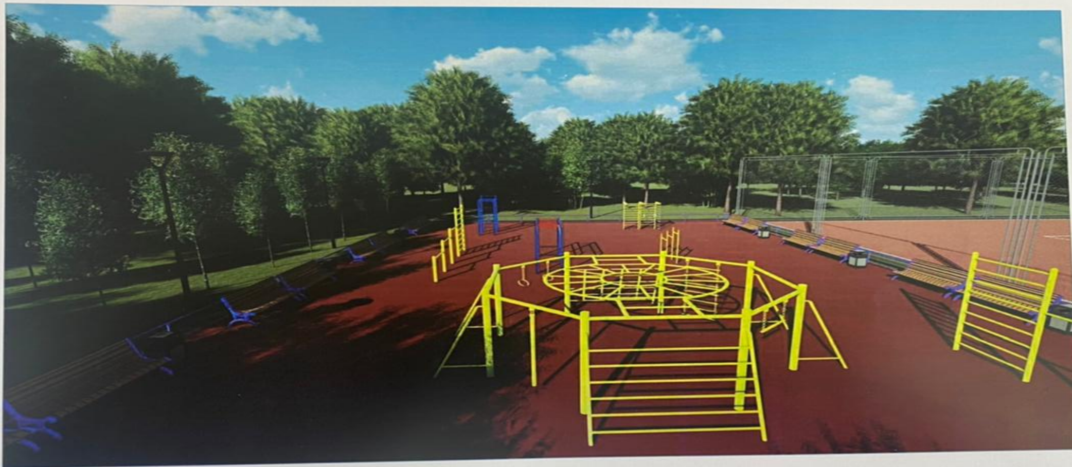
Визуализация площадки №2