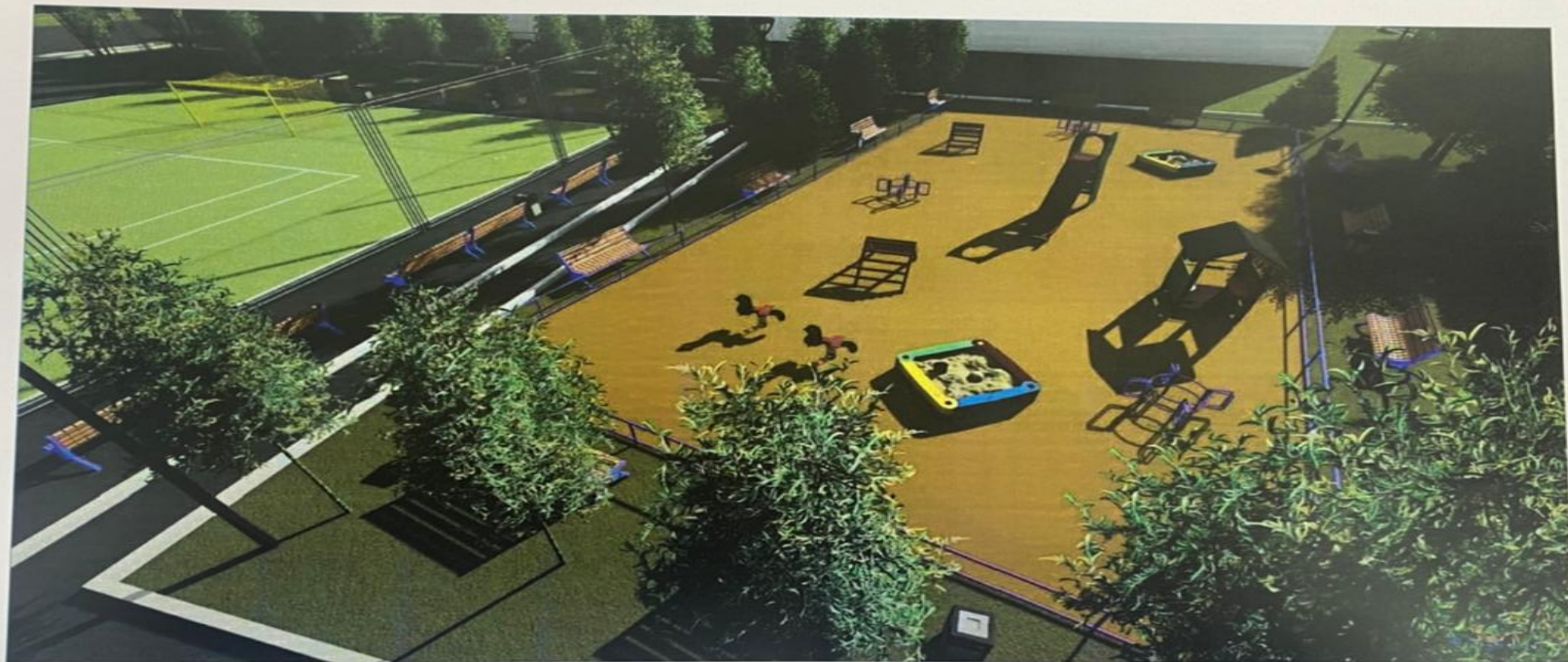
Визуализация площадки №1