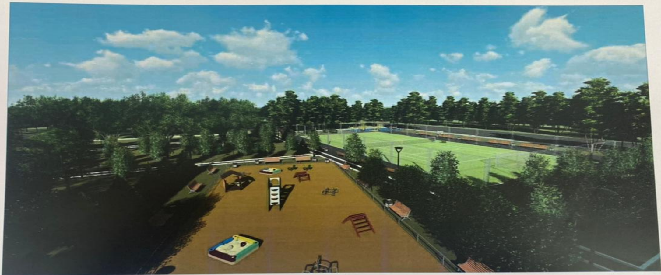
Визуализация. Общий вид