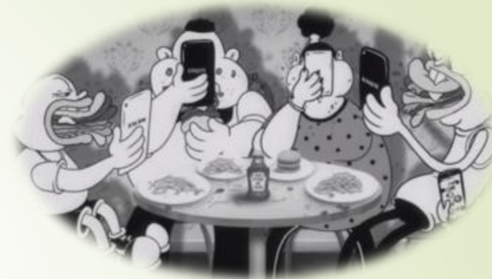
Набор массы тела