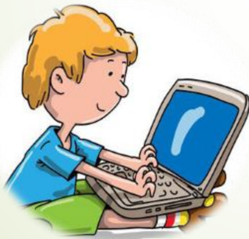
Дети в компьютере