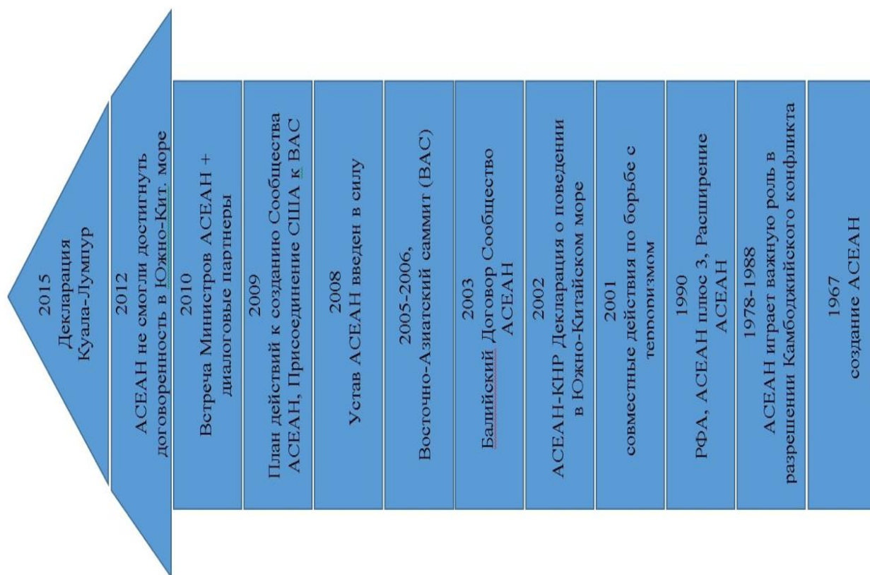
Рисунок 2 – Этапы формирования АСЕАН