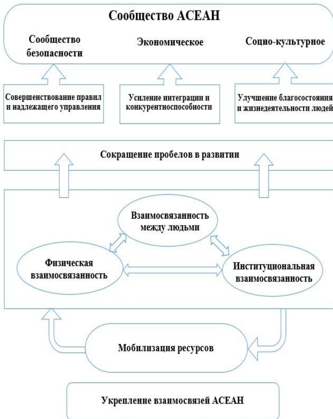
Рисунок 3 – Общая стратегия взаимодействия Сообщества АСЕАН и Генерального плана по укреплению взаимосвязей

заявленного высшего уровня интеграционного процесса – создания полноценного экономического союза, который предполагает не только координацию макроэкономической политики, но и унификацию законодательства в валютной, бюджетной и финансовой областях, отнесено к «вопросам отдалённой перспективы» [184].