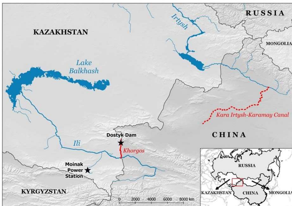
Сурет 2 – ҚХР-ның Ертіс және Іле өзендеріндегі жасанды су арналары көрінісі

Сонымен қатар, Қара Ертіске келіп қосылатын Буыршын өзенінен Үрімжі қаласына дейін ірі су арнасы салынууда. Ол су арнасының бойында ауылшаруашылығын дамытып, шөлейт жерлерді көгалдандыруды көзделуде. Бұл мақсатта су тұтыну көлемі айтарлықтай жоғары болатындығын ескерсек, елімізге ағып келетін Ертіс суының азаяры сөзсіз. Егер бұл жағдай реттелмей одан әрі жалғаса беретін болса, Ертіс өзені елімізде ұсақ өзендер қатарына қосылатындығын мамандар дәлелдап отыр [227].