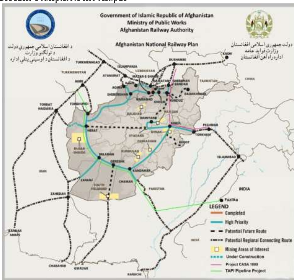
Сурет 1 – Ауғанстан Ислам Республикасының Қоғамдық жұмыс министрлігі бекіткен ұлттық теміржол жоспары

Американдық «Жаңа Жібек Жолы» концепциясы аймақтық энергетикалық қатынастар саласын да қамтыған. АҚШ Ауғанстан мен Орталық Азия елдері арасында электр желілері жүйесінің болғанын қалайды. Бұл тұста да ауған жобаларын жүзеге асыруда Өзбекстанның өзге Орталық Азия