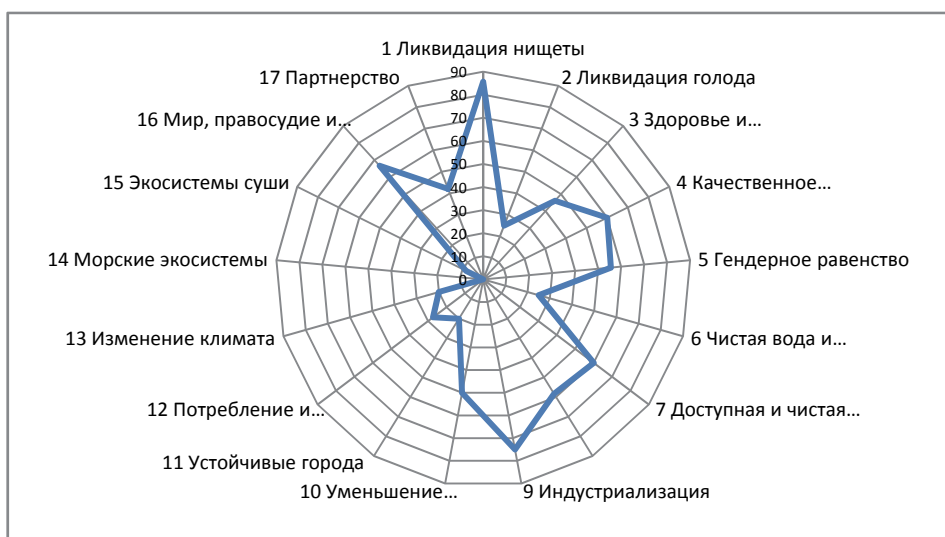
Диаграмма 1 – Интеграция целей устойчивого развития в Стратегию «Казахстан-2050», %

В данной статье проведены первый и второй этапы оценки в части определения приоритетов и направлений Стратегии-2050 в области устойчивого развития и баланса по 5 направлениям устойчивого развития [7]. При этом, при наложении целей и задач устойчивого развития на национальные приоритеты и направления в расчет брались и частичные и полные соотношения без их разделения. Результаты анализа представлены в таблице 1 и в диаграммах 1 и 2. Из них видно, что наибольшее отражение в Стратегии-2050 нашли 1, 9 и 16 цели устойчивого развития, образуя первую категорию целей. Это «борьба с бедностью», «индустриализация, инноваций и инфраструктура» и «мир, правосудие и сильные институты».