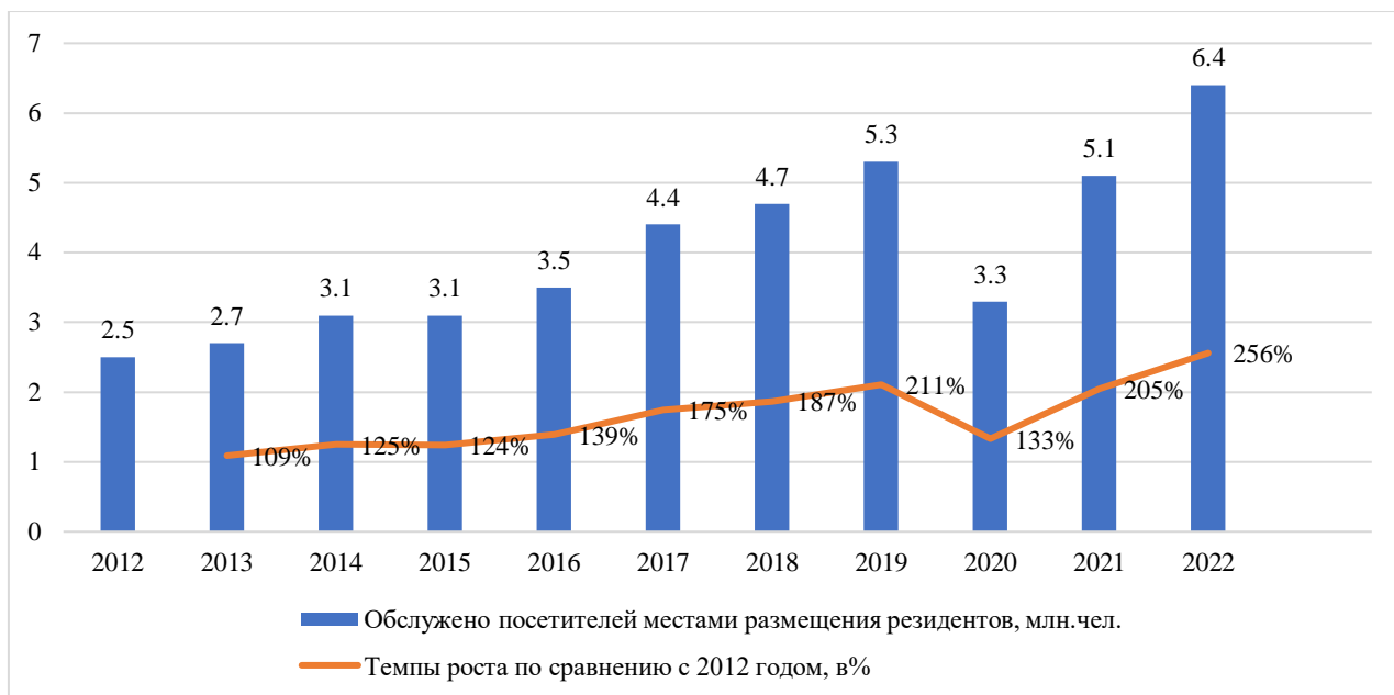
Рисунок 1 - Статистика казахстанских туристов (в млн чел.)

В Казахстане сферу туризма координирует Комитет индустрии туризма Министерства культуры и спорта Республики Казахстан. Статистика казахстанских туристов представлена на Рисунке 1.