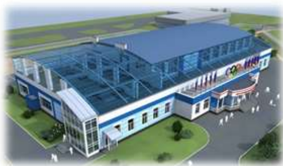
3- сурет – Дене шынықтыру-сауықтыру кешенінің сызбасы. Ескертпе: автормен жасанды интеллект арқылы дайындалған.

Осыған орай, магистрлік жобаның екінші ұсынысы ретінде 2-Шежін ауылынан ДШСК-ны салу алынған. Ұсыныс Мемлекет басшысының 2018 жылғы 5 қазандағы Қазақстан халқына Жолдауына қазақстандықтардың әл-ауқатының өсуі: табыс пен тұрмыс сапасын арттыру"[24], еліміз бойынша кемінде 100 дене шынықтыру-сауықтыру кешенін салу бөлігіне" сәйкес келеді. Бұл ұсыныс спорттық-бұқаралық іс-шараларды өткізу үшін дене шынықтыру - сауықтыру кешенін құруға, сондай-ақ спорт секцияларының ауқымын кеңейтуге және жаңаларын-самбо, үстел теннисі, волейбол, баскетбол ашуға бағытталған.(3 - сурет)