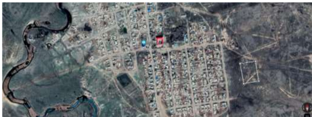
4- сурет – Дене шынықтыру-сауықтыру кешенінің орналасатын жері Ескертпе: Автормен GOOGLE картасы арқылы жасалған.

Операциялық кезең: Кешен 2027 жылдың тамыз айында пайдалануға беріледі деп, өзінің негізгі қызметін бастайды деп жоспарлануда.