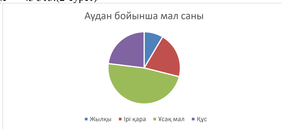
2-сурет – Тасқала ауданы бойынша мал саны

Жыл сайын қарқынды дамып келе жатқан мал шаруашылығы ауыл тұрғындарының негізгі табыс көздерінің бірі болып табылады. Аудан бойынша (2023 жылы) ірі қара мал басы — 40 233 бас, жылқы — 16 837, ұсақ мал — 94 692, құс — 45 513. (2-сурет)