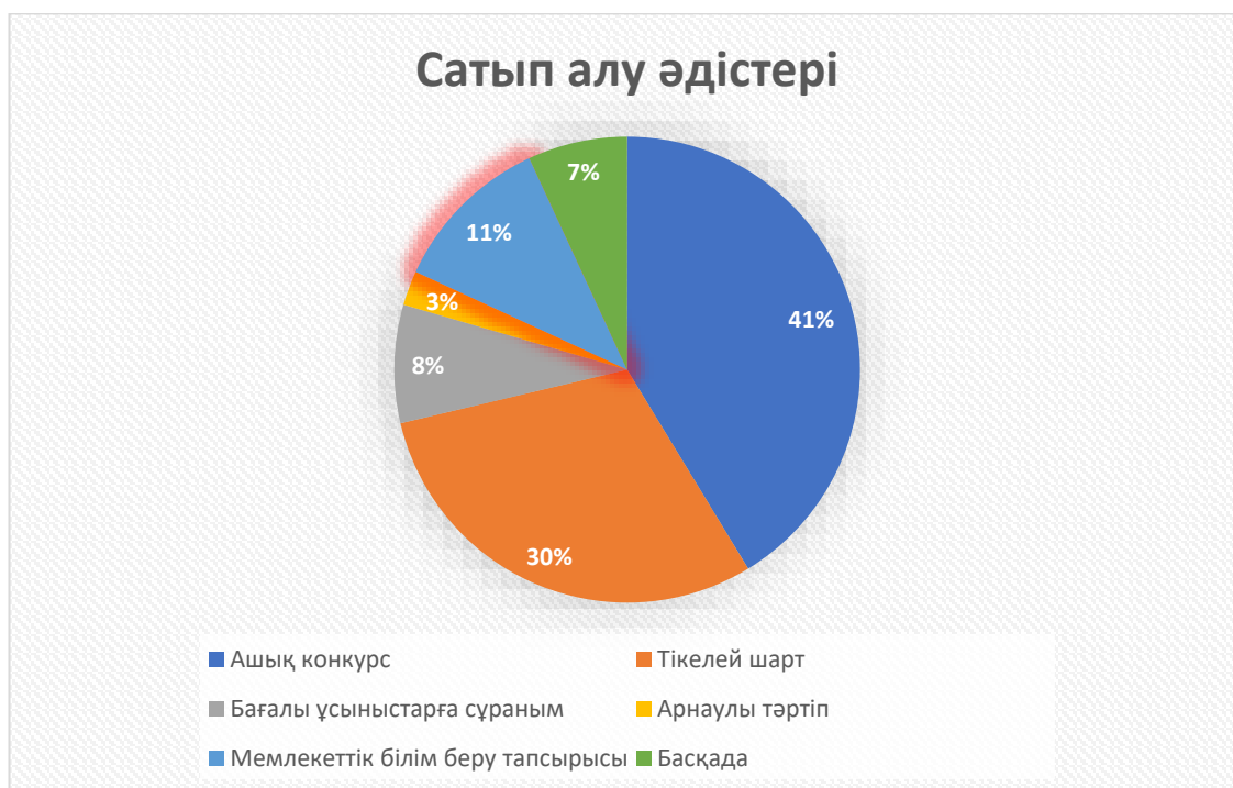
2-сурет – 2022 жылғы мәліметтерге сәйкес, веб-порталда жарияланған мемлекеттік сатып алу әдістерінің пайыздық үлесі

Нақтырық айтқанда, 2022 жылғы жоспарланған сомаға өткізілген мемлекеттік сатып алу әдістері төмендегі 2 суретте көрсетілген.