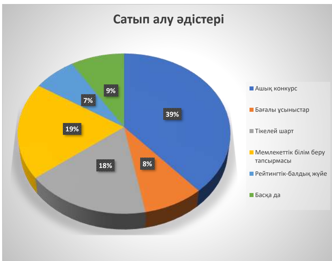
3-сурет - 2022 жылғы мәліметтерге сәйкес, веб-порталда жарияланған мемлекеттік сатып алу әдістерінің пайыздық үлесі

Рейтингтік балдық жүйенің артықшылықтары веб портал автоматты түрде жеңімпазды анықтайды. Бұл өз кезегінде сатып алуды өткізу мерзімін азайтып, тіпті коррупциялық тәуекелділіктерді азайта түседі. 2023 жылғы сатып алу сомасының пайыздық үлесі төмендегідей