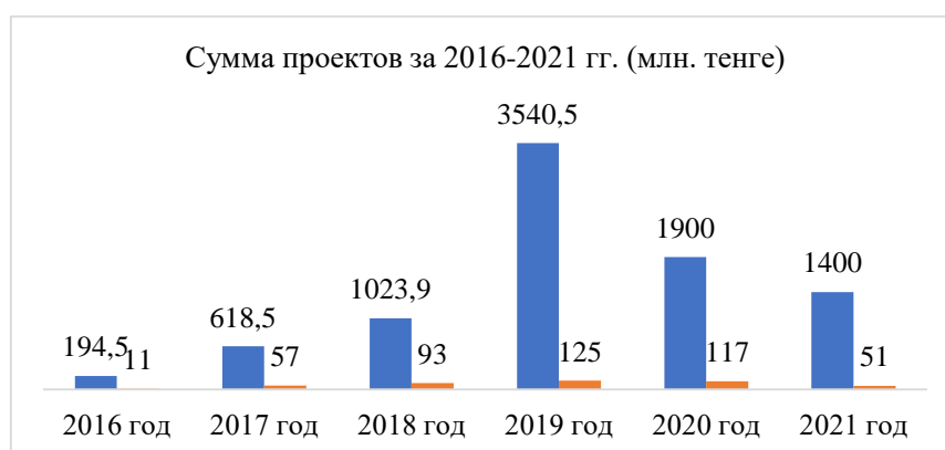
Рисунок 3. Динамика грантового финансирования НПО по проектам

В соответствии с подпунктом 7-1) статьи 1 Закона грантовое финансирование – усовершенствованная форма реализации совместных проектов с НПО с 2016 года. Данный механизм был внедрен в целях реализации отраслевых проектов и инициатив НПО для значительного роста в проектном сотрудничестве государства с НПО [11]. По официальным данным уполномоченного МИОР грантовое финансирование НПО показали следующую динамику с 2016 года по 2021 годы согласно 3-рисунку.