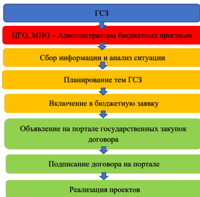
Рисунок 1. Этапы формирования и реализации ГСЗ

НПО также участвуют в государственных закупках, но для этого требуется взнос в размере 30% от суммы стоимости услуги, которые ограничивают НПО в участии в данном процессе. В соответствии с Правилами формирования, мониторинга реализации и оценки результатов ГСЗ (далее – ПФМПОР ГСЗ) определены три этапа формирования и три этапа реализации ГСЗ приведены на 1-рисунке [10]: