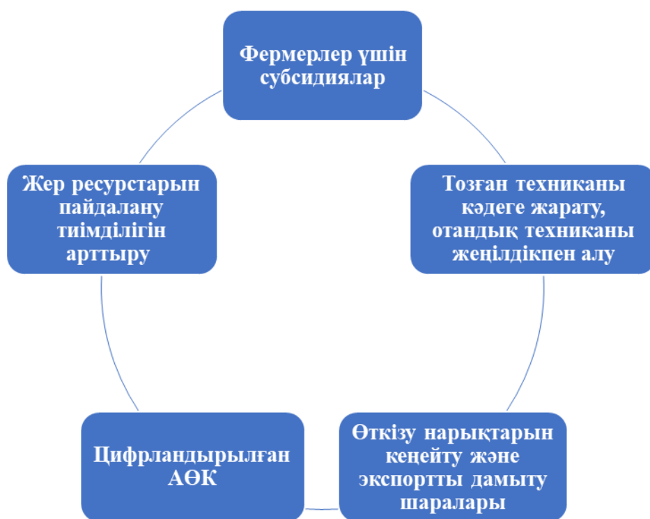
4.2 сурет – Аграрийлерді мемлекет тарапынан қолдау тетіктері Ескертпе – автор дереккөз негізінде құрастырған [14]

Мемлекет басшысы алға қойған міндеттері атап көрсеткен басымдықтары аясында ауылшаруашылығы саласының қызметкерлері үшін бірқатар субсидия түрлері көрсетілген. Онда, өсімдік шаруашылығы саласында ауыл шаруашылығы дақылдарын қорғалған топырақта өндеп өсіруге жұмсалатын шығындардың құнын субсидиялау ұсынылды. Бұған қоса, жеміс-жидектер мен көпжылдық жүзімнің көшеттерін отырғызуға, өсіруге (оның ішінде қалпына келтіруге) жұмсалатын шығындардың құнын, минералды тыңайтқыштардың (органикалық тыңайтқыштарды қоспағанда) бағасын субсидиялап, тұқым шаруашылығын, мақта, шитті мақтаның сапасына сараптама жасауға жұмсалатын шығындар құнын қаржыландыру қарастырылған (сурет 4.2).