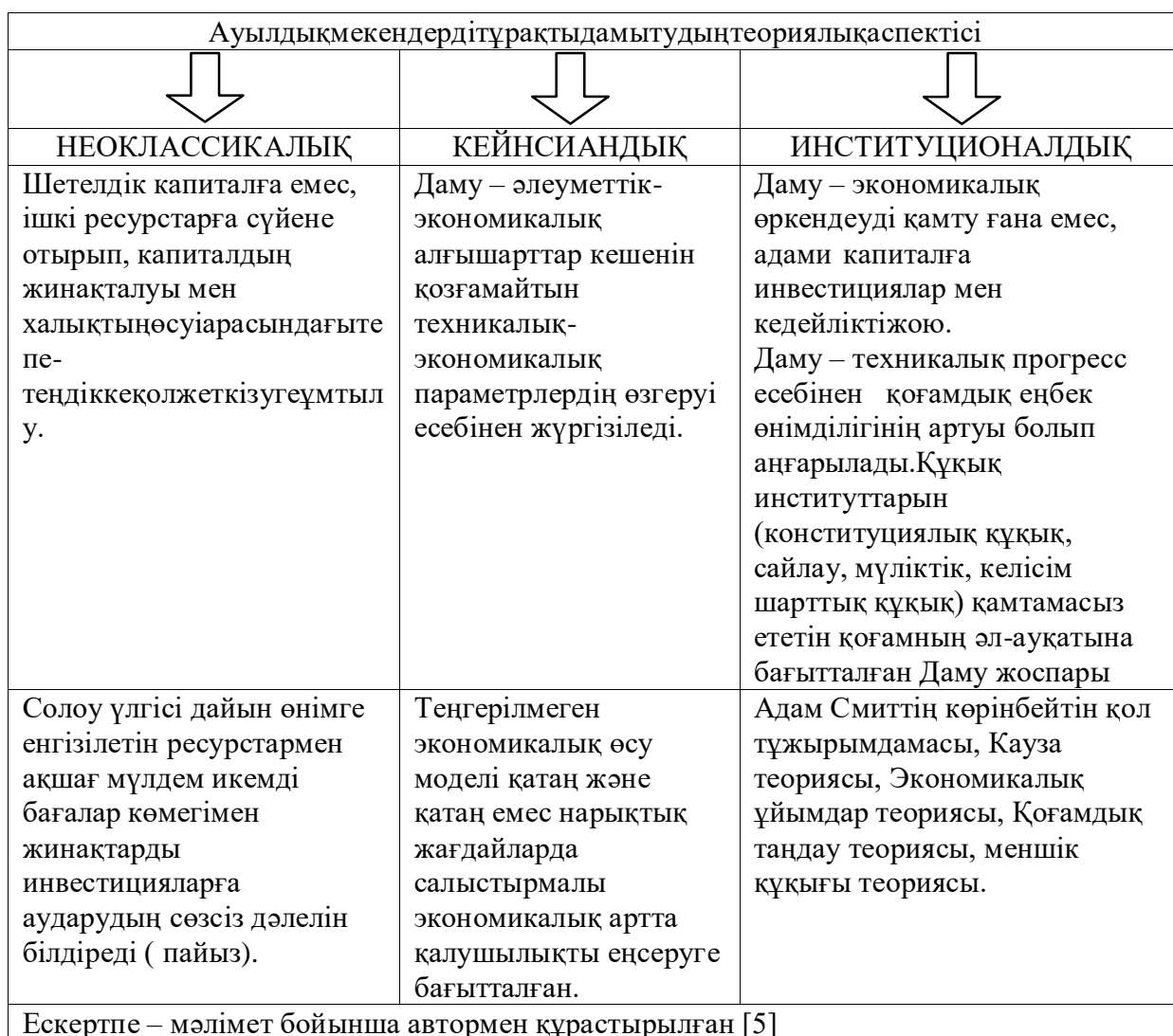
1 кесте – Ауылдық аумақтардың даму теориялары