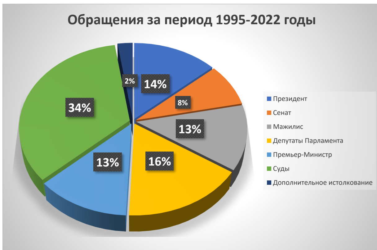
Рисунок 1 – статистика обращений в Конституционный Совет за период 1996-2022 годы в разрезе по субъектам обращения.

Как можно видеть из таблицы, большая часть поступивших обращений приходится на начальный этап функционирования Конституционного Совета. С 1996 года по 2004 год в Совет поступало в среднем от 10 до 20 обращений в год. Начиная с 2005 года количество обращений начало уменьшаться, тем самым в среднее количество в год составило 5 обращений.