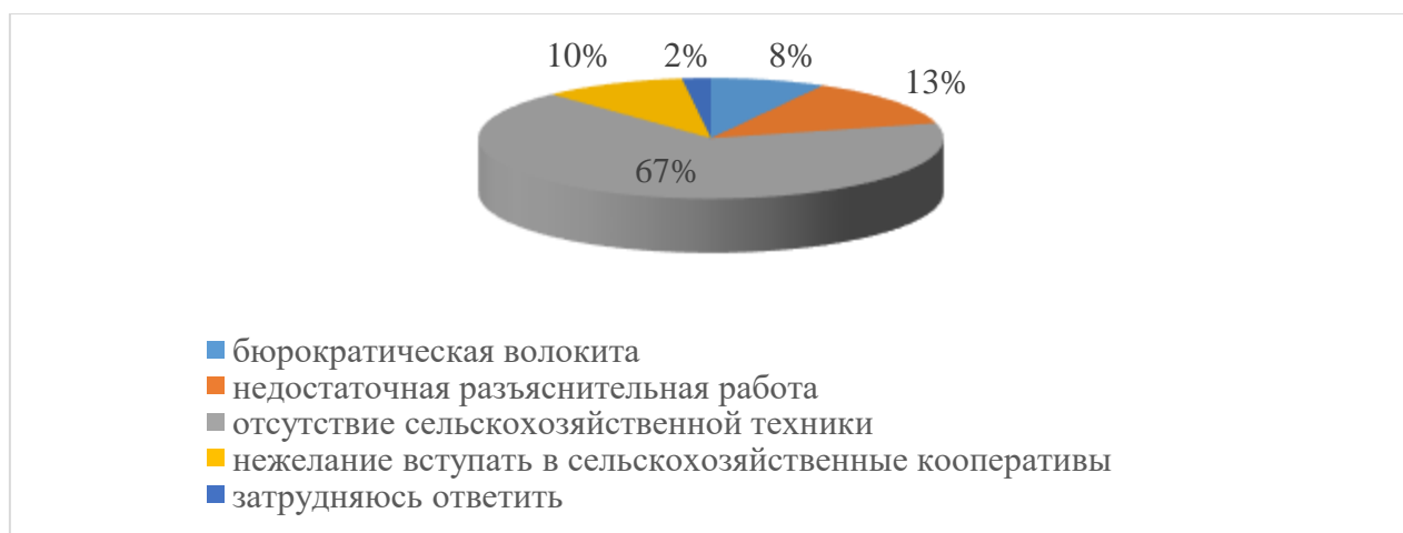
Рисунок 3 – Основные барьеры в процессе реализации пилотного проекта

Согласно опроса в реализации проекта участвует 57% мужчин, 43% женщин разных возрастных групп (18-29 лет – 22%, 30-49 лет – 63%, 50-65 лет – 45%)