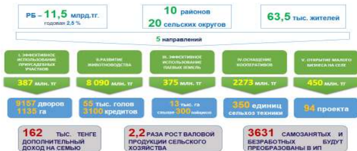
Рисунок 1 – Необходимые средства для дальнейшей реализации пилотного проекта по повышению доходов населения области

(124,7 млн. тенге/год * 5 лет). За 4 месяца 2021 года на счета АО «СПК» Тараз поступило возвратных средств 1 млрд. 136 млн. тенге или 15,7% от 7,2 млрд. тенге. С учетом эффективности реализуемого в регионе пилотного проекта «По повышению доходов населения Жамбылской области», для дальнейшего продолжения необходимо дополнительно 11,5 млрд. тенге (рисунок 1).