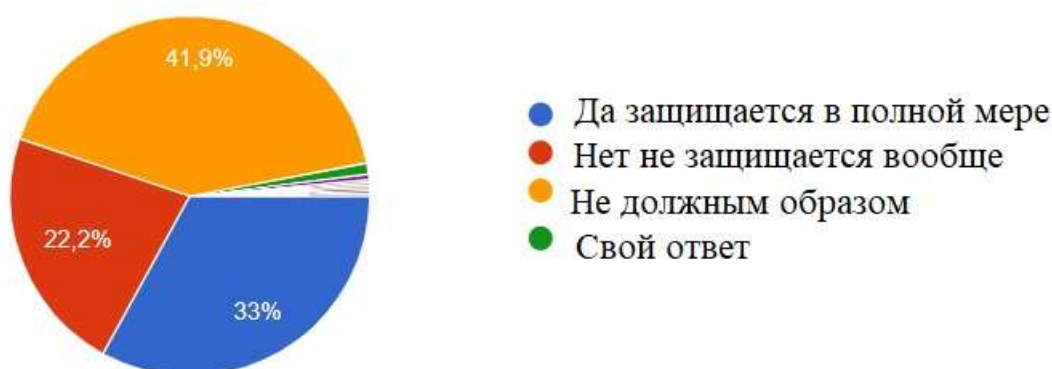
Рисунок 4 – По защите объектов интеллектуальной собственности.

По результатам опроса также была получена информация о том, как обеспечена защита прав интеллектуальной собственности в Казахстане. Большинство опрошенных, а именно 41,9%, выразили мнение, что защита объектов интеллектуальной собственности не обеспечена должным образом. 33% опрошенных утверждают, что защита осуществляется должным образом, в то время как оставшиеся 22,2% ответили, что не знают или не владеют информацией на этот счет. (Рисунок 4)