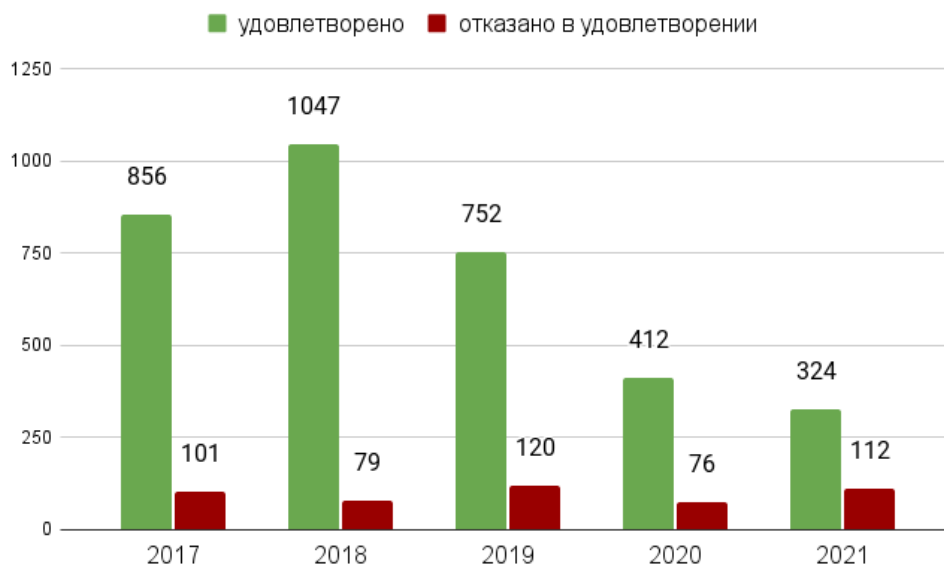
Рисунок 1 – Сведения об удовлетворении исковых требований по делам о защите прав ИС за 2017-2021 годы

В период с 2017 по 2021 год из 3879 гражданских дел, рассмотренных в первой степени, 3391 (87%) привел к подаче заявок, а 488 (13%) были отклонены.