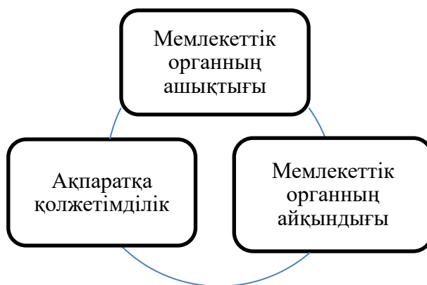
2 - сурет. Жергілікті атқарушы органдардың қызметінің ашықтығының құрамдас элементтері.

«Айқындық» ұғымы мен «ашықтық» ұғымының айырмашылығы, айқындық ол - мемлекеттік органдардың қоғам алдындағы жауапкершілігіне тікелей байланысы және мемлекеттік органдардың шешімдерімен азаматтардың танысуына, баға беруіне қолжетімділігін білдіреді, ал ашықтық ол - бүкіл қоғамның мемлекеттік басқаруға барынша қатысуына бағытталған, яғни өзін-өзі басқаруға, мемлекеттік органдардың өзін-өзі қадағалауына және оқшаулануға қарама-қайшы түсінік. (1-сурет)